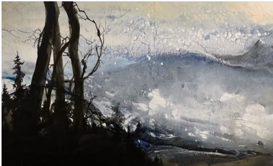
Peinture de Jean-Michel Bénier