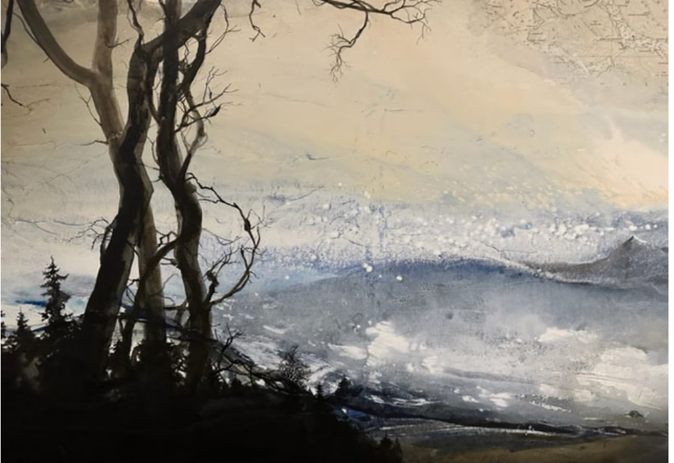
Peinture de Jean-Michel Bénier

Portes Ouvertes de la Réserve Naturelle Régionale de La Massonne