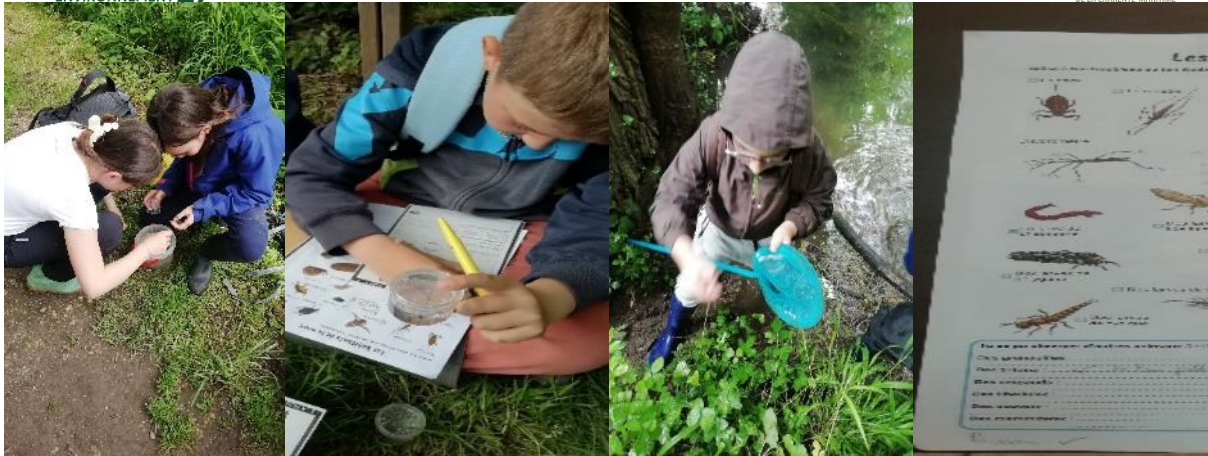
Figure 2 - Pêche, observation, identification