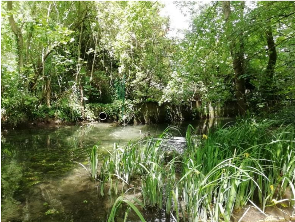
Figure 1 - La Gères

Nous nous sommes rendus sur les bords de Gères afin de faire une pêche aquatique et de relever le défi « plonge dans la mare » de la FCPN.