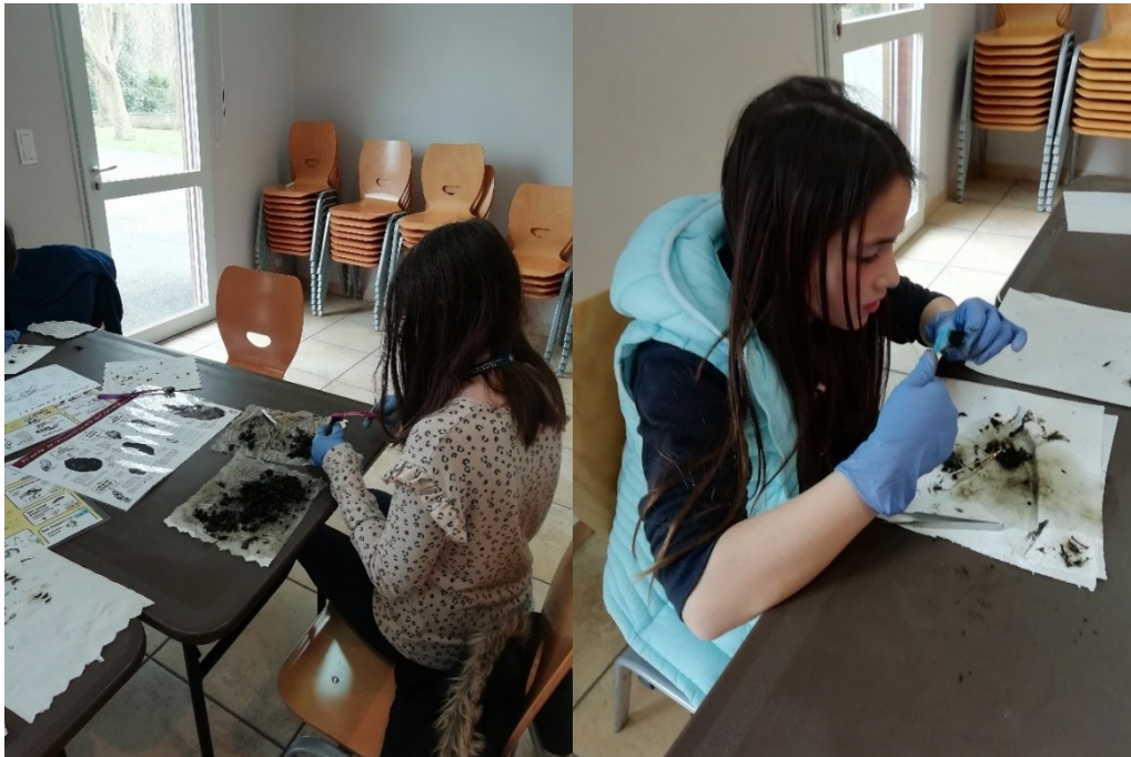
Figure 1 - Dissection de pelotes en cours : tri des poils et ossements

Dans ce contexte, nous avons proposé aux explorateurs ainsi qu'à leurs parents de participer à cette étude en analysant - et en déterminant les crânes notamment – des ossements retrouvés.