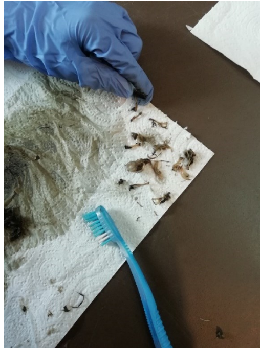
Figure 2 - Nettoyage des ossements en attente d'identification

Avec l'aide de ma collègue Mélanie, qui travaille sur ce projet au sein de NE17, les explorateurs ont pu alimenter la base de données des espèces de micromammifères en allant jusqu'à l'identification des espèces retrouvées dans les pelotes. Les explorateurs ont également pu trier et nommer l'ensemble des ossements retrouvés et les coller sur du double-face afin de repartir à la maison avec ces éléments scientifiques.