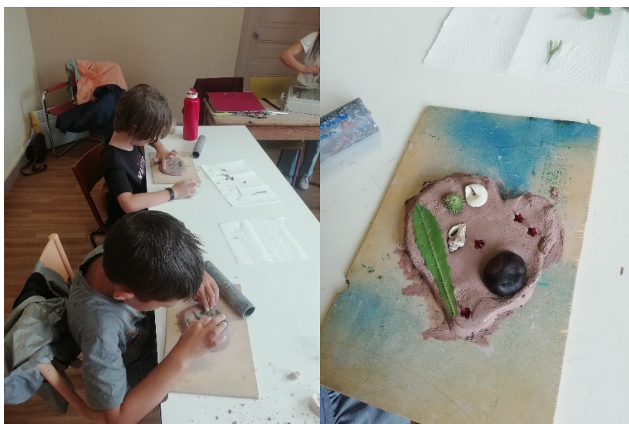
Figure 1 - Préparation du moulage et des empreintes