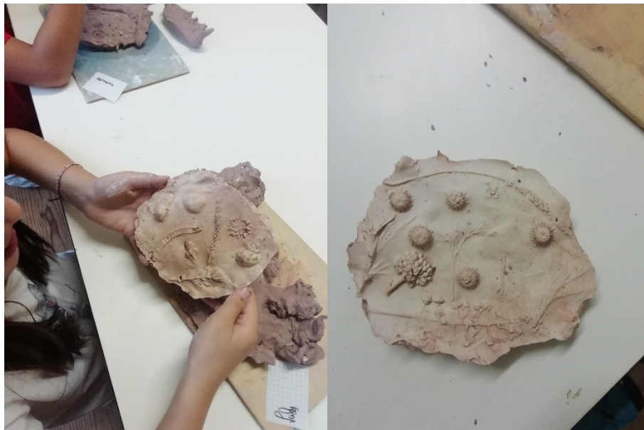
Figure 3 - Démoulage et découverte des résultats !

Les explorateurs sont repartis avec leurs œuvres souvenir. Ensuite ils pourront les nettoyer avec une brosse à dent et / ou le peindre s'ils le souhaitent.