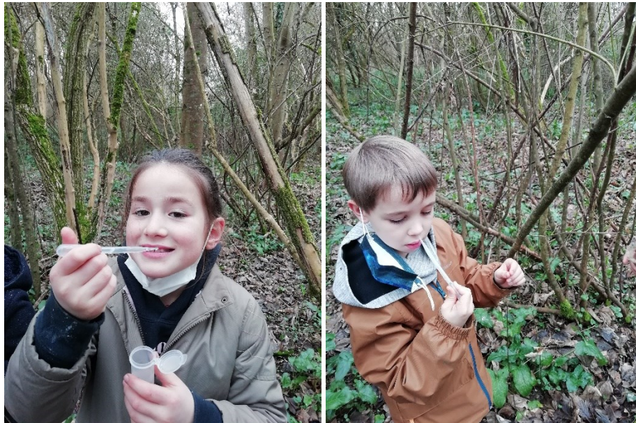
Figure 4 - Le parfum de la nature

Notre investigation s'est poursuivie en découvrant les odeurs par le biais de « l'exhausteur d'odeur », une goutte d'exhausteur sous le nez, et les parfums de la nature se révèlent à nous !