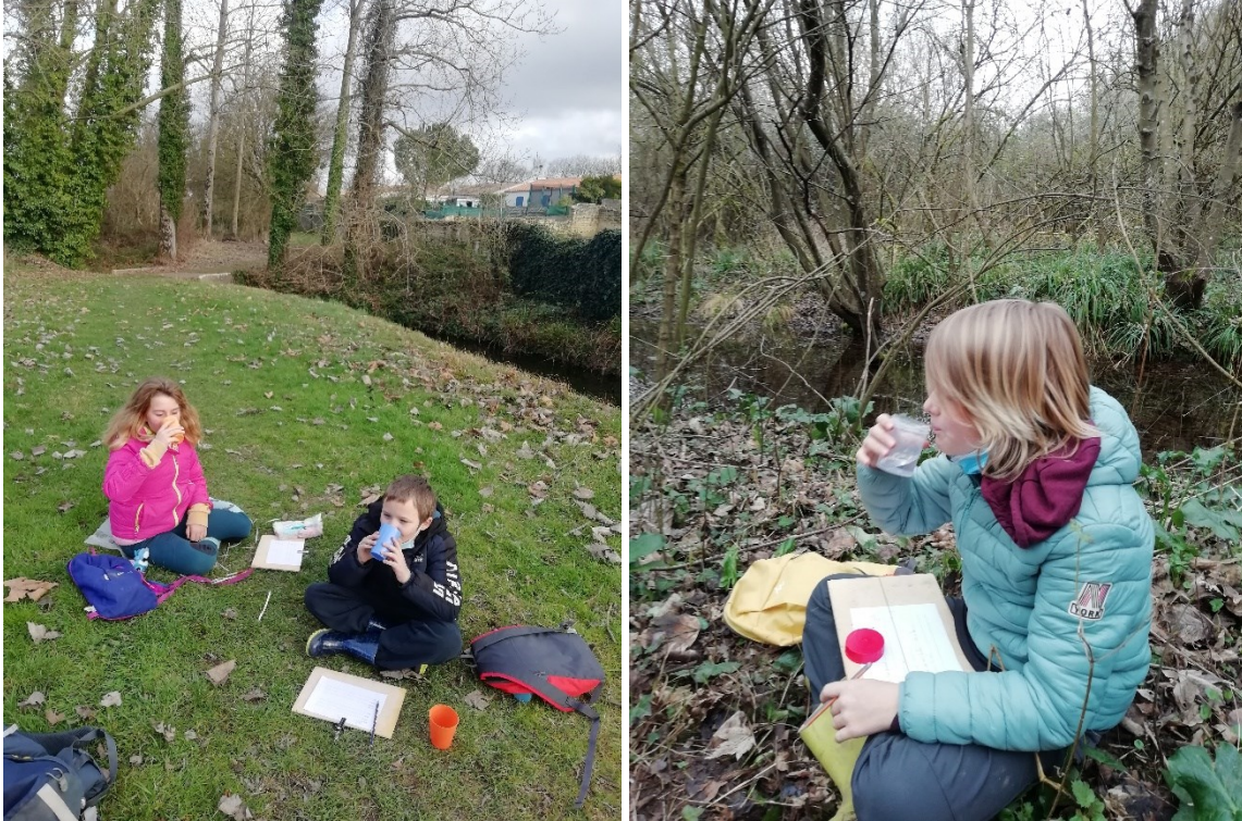
Figure 5 - Bar à eau

Nous aurons probablement l'occasion d'en reparler plus tard, en abordant les différentes sources de puisement / collecte des eaux potables.