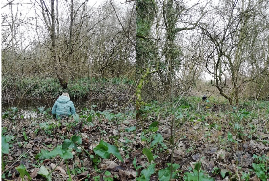
Figure 3 - Temps d'écoute

Notre investigation s'est poursuivie en découvrant les odeurs par le biais de « l'exhausteur d'odeur », une goutte d'exhausteur sous le nez, et les parfums de la nature se révèlent à nous !