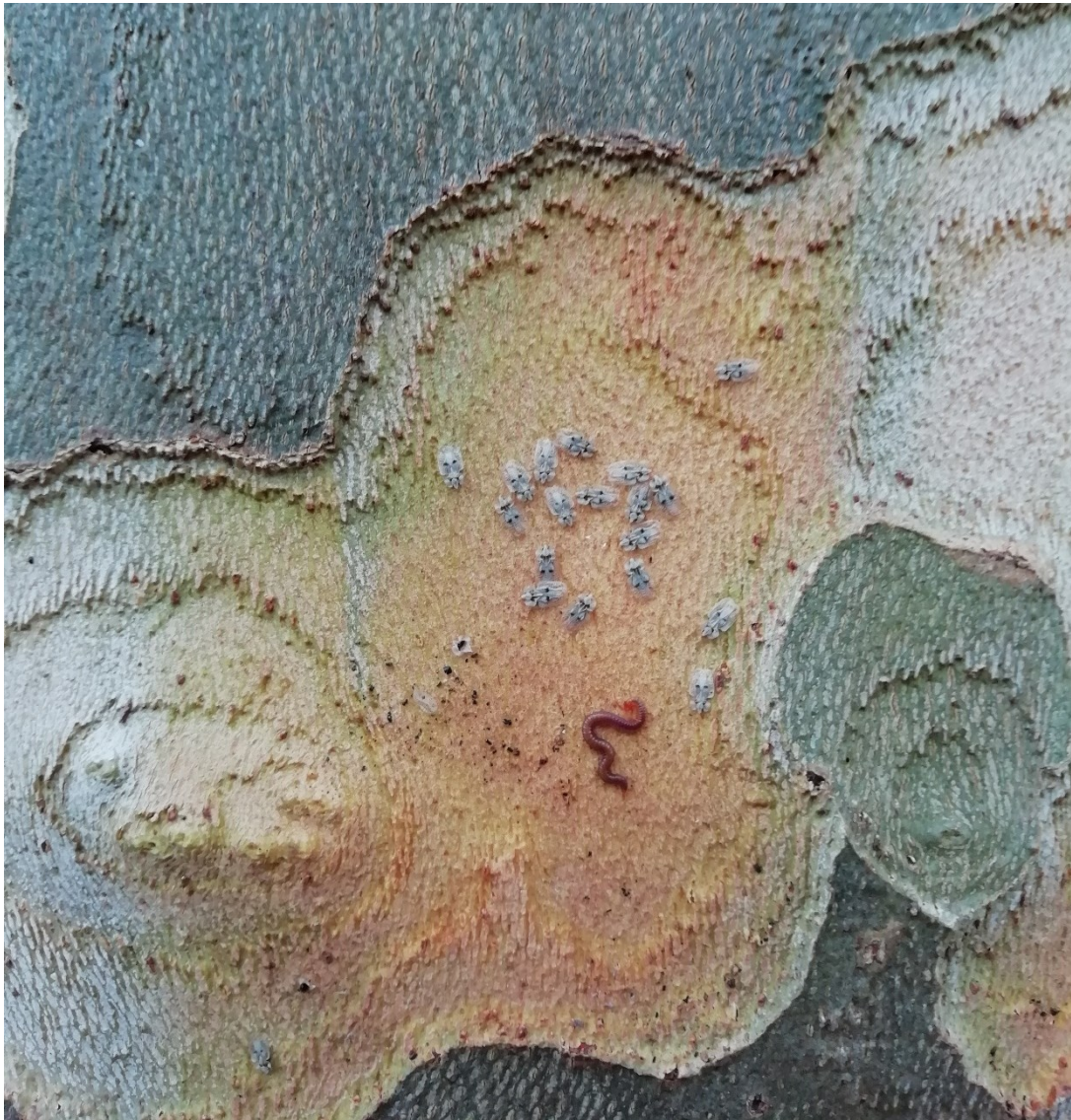
Figure 6 - Tigre du platane et myriapode

Les adultes hivernent sous les écorces en attendant les beaux jours pour se rendre sous les jeunes feuilles afin d'y pondre leurs oeufs.