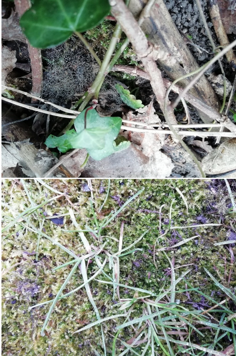
Figure 2 - exemples de gouttes d'eau perçues dans la nature : sur l'herbe et les toiles d'araignées

Puis, une fois que nous avons pénétré dans le monde de l'eau, nous avons observé où nous pouvions trouver de l'eau.