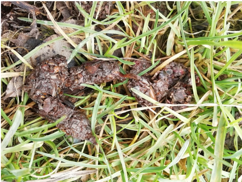
Figure 7 - Épreinte de loutre